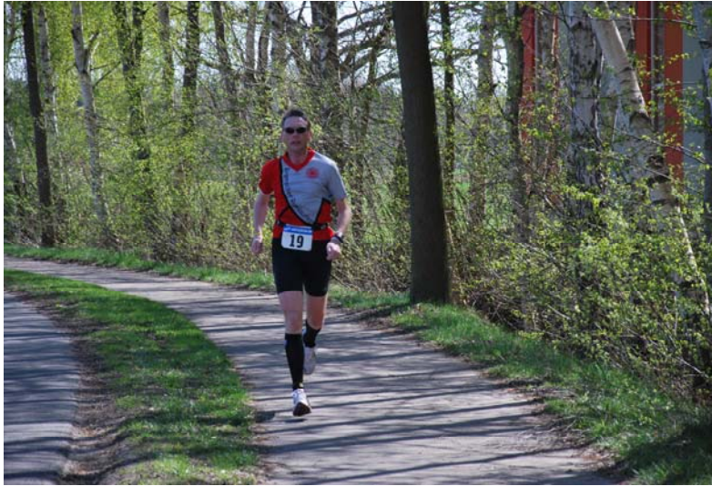
Immer noch aufrecht und mit einer sauberen Flugphase bei jedem Schritt – am „Bullermeck“ bei Rieste, km 38

Nach Passieren der Ortschaft Malgarten ging es links ab in Richtung Maschort, so dass ich meinem Heimat-