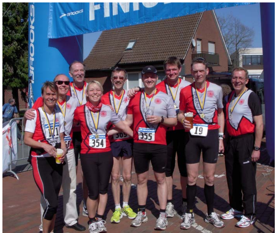
Gruppenbild der Rumläufer, nachdem auch der "Ultra" endlich im Ziel war

restlichen Teil der Strecke vom Reservebecken über Heeke nach Bersenbrück waren dann viele Jugendmannschaften und Läufer unterwegs, die diesen Teil der Strecke als Sternlauf absolvierten bzw. die auf einer 11 km Runde unterwegs waren. Sie hatten angesichts des schönen Frühlingwetters ihren Spaß, auch wenn sie bereits nach einigen km Gehpausen einlegen mussten. Sei's drum, ich kam auch auf den letzten km der Strecke gut zu-