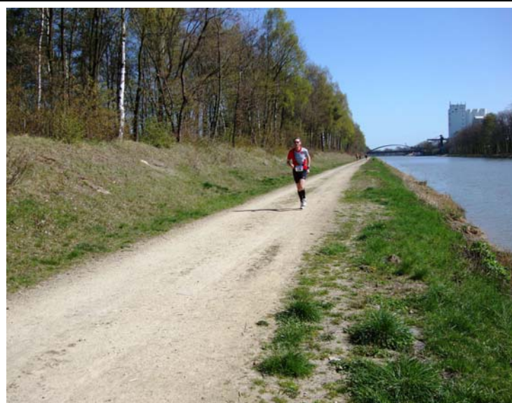
“Loneliness of a long distance runner“ - am Mittellandkanal kurz vor der Igel-Brücke bei km 25

An der Igel-Brücke führte die Strecke dann wieder vom Kanal weg und es ging auf Nebenstraßen in Richtung Lappenstuhl / Malgarten / Rieste. Während mir die erste Streckenhälfte zumindest vom Laufen her unbekannt war und somit ihren Reiz hatte, musste ich mich auf der mir bestens bekannten 2. Streckenhälfte, auf der ich regelmäßig mit den Kollegen vom Lauftreff bzw. auch allein unterwegs bin, zusammenreißen, um nicht in einen langsamen und gleichmütigen Trott zu verfallen.