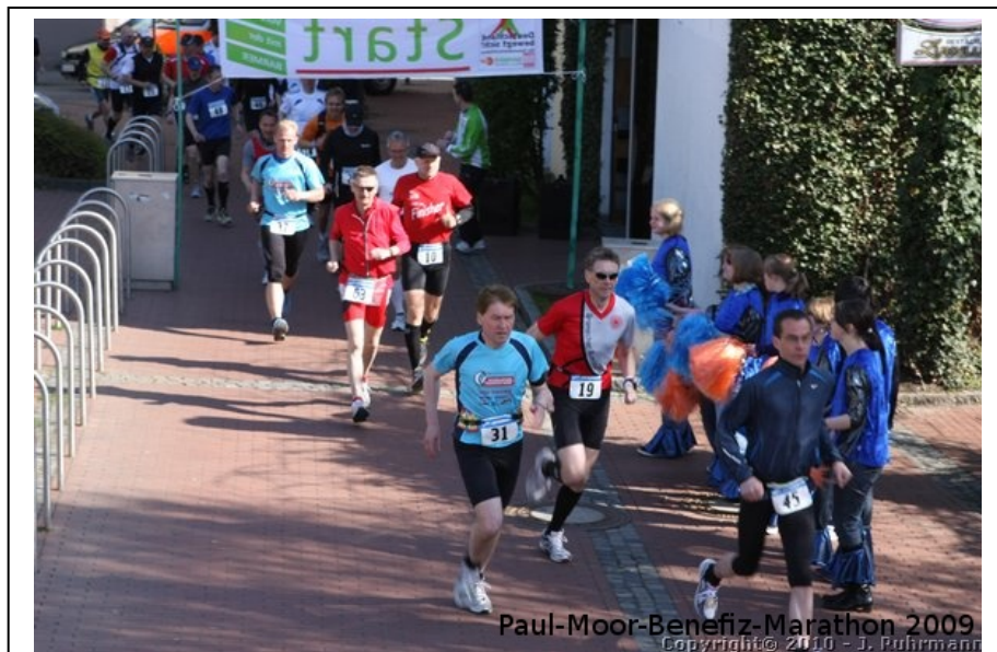
Nach dem Start ging es bei der Tanzschule Hull zunächst 3 x um den Block

Sonnencreme, Trinken, ...) und um 10:33 h erfolgte schließlich der Start für 85 Läuferinnen und Läufer auf der 50 km Strecke durch das Osnabrücker Land zurück nach Bersenbrück. Weil irgendjemand die Organisatoren darauf aufmerksam gemacht hatte, dass die Strecke nur 49,8 km lang sei (?) liefen wir zum Ausgleich der fehlenden 200m zunächst 3 x um den Block, bevor es dann über die Bramscher Straße und durch den Bürgerpark in Richtung Nettetal ging. Die ersten km der Laufstrecke waren insgesamt recht