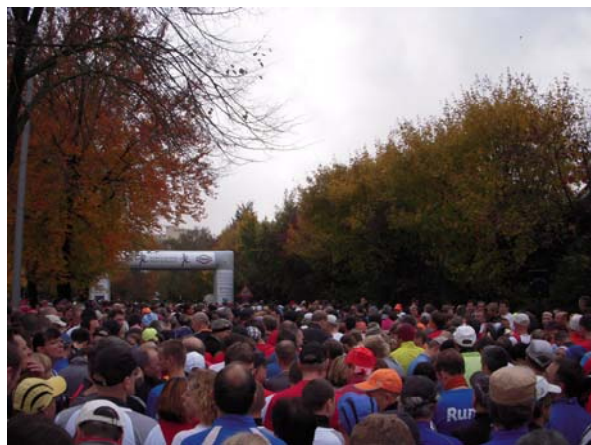
Vor dem Start mit 3.000 Gleichgesinnten, kurz bevor es endlich losgeht!

Für die 3 Hauptstrecken des Tages, d.h. Halbmarathon, Marathon und Ultra-Marathon mit insgesamt