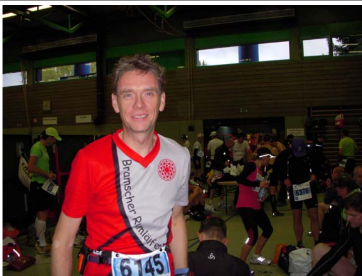
Morgens im Umkleidebereich, bereits etwas kribbelig , vor dem Start!

Im Hotel gab es morgens ab 06:00 h ein reichhaltiges Frühstücksbuffet und ab 07:30 einen Shuttle-