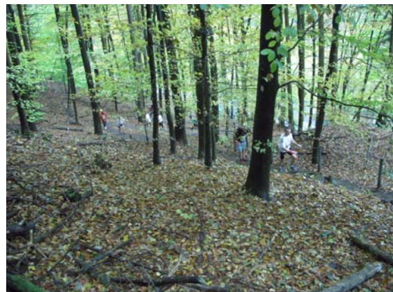
Nach ca. 2:43 Laufzeit bei km 28 die zweite steilere Passage des Tages, gehen statt laufen mit Blick nach oben bzw. Blick zurück nach unten