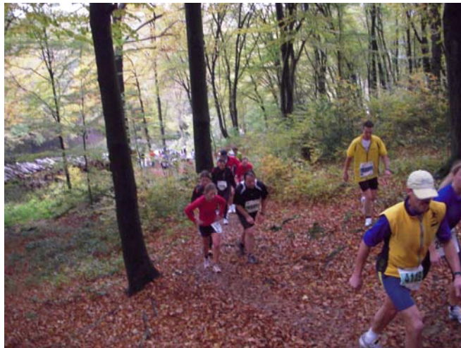
Bei km 18 nach ca. 1:42 Laufzeit die erste steile Passage, auf der Laufen nicht mehr möglich war

Ab km 7 führte die Laufstrecke dann auch durch den herbstlich bunten Wald, der trotz des bedeckten