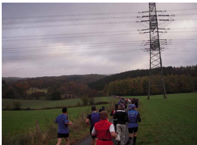
Bei km 6, endlich außerhalb der Stadt

Auf den ersten km der Strecke war das Läuferfeld noch recht dicht zusammen und es war nicht einfach, seinen Rhythmus zu finden. Die Straßen in Lennep waren schmal, teilweise noch nass vom nächtlichen Regen und es ging von Anfang an rauf und runter. Nach knapp 5 km ging es dann endlich raus aus der Stadt, so dass wir schon bald einen herrlichen Blick auf die hügelige Landschaft des Bergischen Landes hatten. Diese schöne Landschaft durfte ich dann in den nächsten 6 h mit fast allen Sinnen „genießen“!