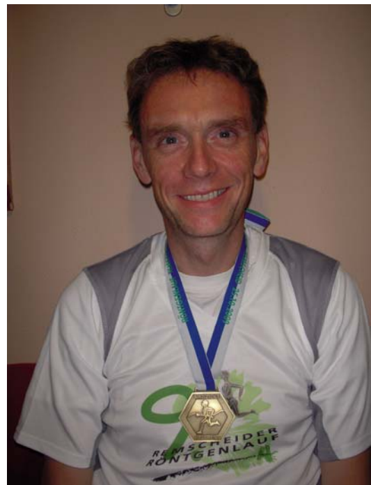
Wieder zu Hause, abends gegen 19:00 h – müde & hungrig, aber auch mächtig stolz !!!

Im Sportzentrum Hackenberg habe ich nach dem Lauf erst einmal in Ruhe heiß geduscht, habe eine Kleinigkeit gegessen, bei der Siegerehrung zugesehen und bin dann, nachdem ich keine Bekannten mehr getroffen habe, gegen 16:30 wieder mit dem Shuttle-Bus zum Hotel gefahren. Dort habe ich meine Tasche ins Auto gepackt und bin ohne Eile nach Hause gefahren.