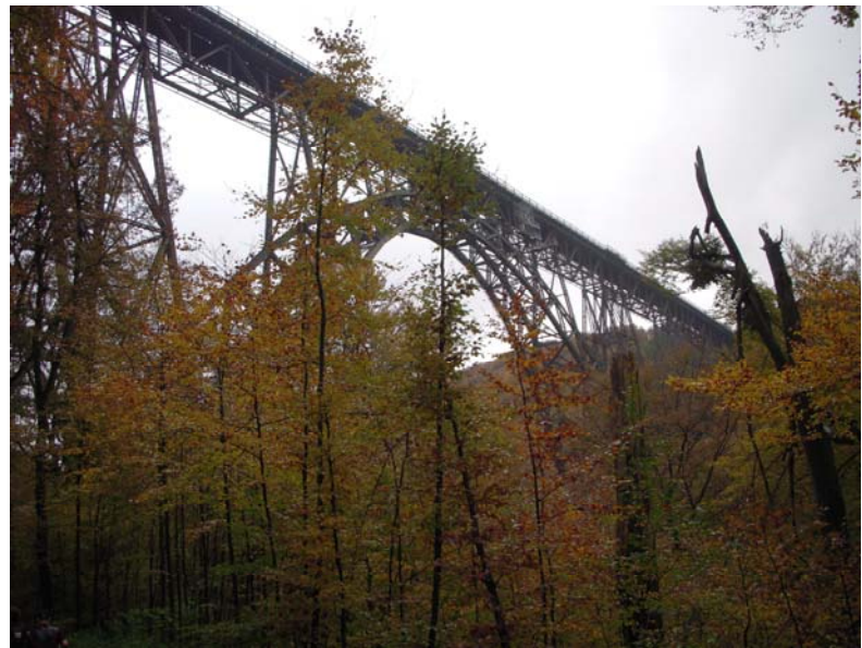
Die Müngstener Brücke: 107 m hoch über der Wupper

Die Müngstener Brücke überspannt die Wupper als höchste Eisenbahnbrücke Deutschlands in einer Höhe von 107 m. Am letzten Sonntag im Oktober wird hier das Brückenfest gefeiert, und es fahren historische Züge zwischen