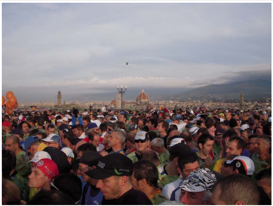
Kurz vorm Start, noch ein letzter Blick über den Startblock und die Stadt