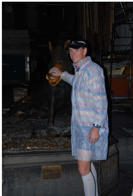
Als Marathonläufer kommt man an bestimmten Ritualen nicht vorbei.

Langsam ging es anschließend weiter zum Start auf der Piazzale Michelangelo, wo gegen 08:00h schon viele der gemeldeten ca. 10.000 Läufer anwesend waren. Quer über den Platz waren die Startblöcke mit Absperrgittern vorbereitet, und es gab gesonderte Bereiche nach den zu erwartenden bzw. angemeldeten Zielzeiten. Der Zugang wurde jedoch nicht überprüft, und es herrschte ein entsprechendes Gedränge in den Blöcken. Der Start sollte eigentlich um 09:00h erfolgen, er verzögerte sich jedoch wegen irgendwelcher Probleme mit der Live-Übertragung im Fernsehen (Berlusconi?) um mehr als 20 min. Diese zusätzliche Wartezeit im Gedränge des Startblocks mit den über dem Platz kreisenden TV-Hubschraubern nervte gewaltig, und sie brachte meinen Rhythmus durcheinander.