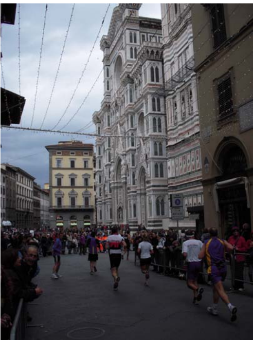
Zum 2. Mal am Dom vorbei, km 39,7

Derart erleichtert konnte ich den Rest der Strecke tatsächlich noch genießen, und die Eindrücke auf den letzten km in einigen Bildern festhalten. Während sich z.B. beim Berlinmarathon, als ich bis zum Schluss im (relativ) hohen Tempo durchziehen wollte, aber angesichts der Umstände doch keine Verbesserung der Bestzeit geschafft hatte, auf den letzten km eine Art Tunnelblick mit eingeschränkter Wahrnehmung der Umgebung eingestellt hatte, blieb ich in Florenz Dank der zur Hälfte getroffenen Entscheidung (s. o.) davon verschont.