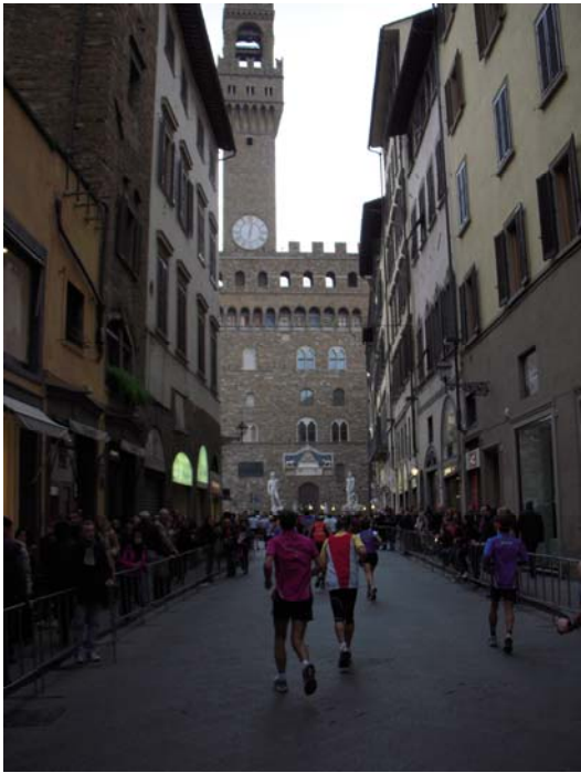
Richtung Palazzo Vecchio, km 39

die freundlich applaudierten, als wir bei km 27 zum ersten Mal zum Dom kamen. Zwischen Dom und Baptistarium ging es weiter zur Piazza della Repubblica, durch den großen Torbogen über die Via degli Strozzi Richtung Arno und zum Parco delle Cascine. Auch in diesem schönen Park, den wir einmal umrundet haben, waren am Sonntagvormittag wenig Zuschauer bzw. Spaziergänger oder Jogger unterwegs. Bei km 34 erreichten wir an der Nordwestspitze des Parks wieder den Arno, und es ging links ab, am Ufer entlang wieder zurück in Richtung Innenstadt. Noch im Park musste ich dann bei km 36 einmal nach links in die Büsche, um das kurz vor dem Start getrunkene Wasser loszuwerden.