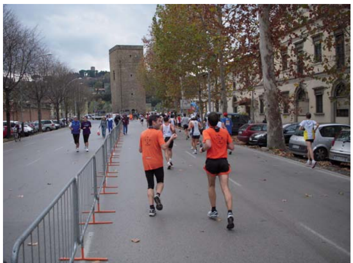
Auf der Viale della Giovine Italia, noch knapp 1 km bis zum Ziel