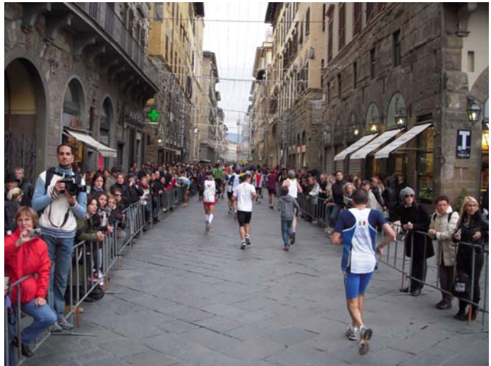
Auf der gepflasterten Via del Calzaiuoli, Richtung Dom, km 39,5

Derart erleichtert konnte ich den Rest der Strecke tatsächlich noch genießen, und die Eindrücke auf den letzten km in einigen Bildern festhalten. Während sich z.B. beim Berlinmarathon, als ich bis zum Schluss im (relativ) hohen Tempo durchziehen wollte, aber angesichts der Umstände doch keine Verbesserung der Bestzeit geschafft hatte, auf den letzten km eine Art Tunnelblick mit eingeschränkter Wahrnehmung der Umgebung eingestellt hatte, blieb ich in Florenz Dank der zur Hälfte getroffenen Entscheidung (s. o.) davon verschont.