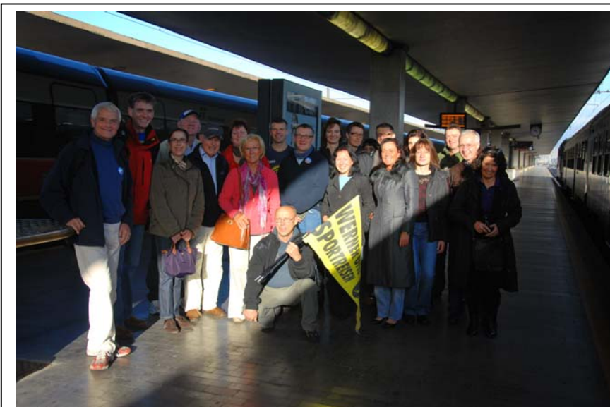
Mit der Reisegruppe vor der Abfahrt zur Marathonmesse