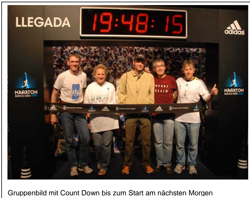
Gruppenbild mit Count Down bis zum Start am nächsten Morgen

Am Samstag stand nach dem Frühstück der Besuch der Marathonmesse mit der Abholung der Startunterlagen auf dem Programm. Hier gab es neben den Ständen der üblichen Verdächtigen auch einen nachahmenswerten Service des Veranstalters. Man konnte sich kostenlos seinen Namen auf das mit den Start-Nrn. ausgegebene Finisher Shirt drucken lassen. Gegen Mittag sind wir wieder aufgebrochen, haben dem alten Friedhof im Stadtteil Ricoleta einen kurzen Besuch abgestattet und sind wieder zurück Richtung Hotel gebummelt. Am späten Nachmittag haben wir uns in einem Restaurant in der Nähe des Quartiers für den anstehenden