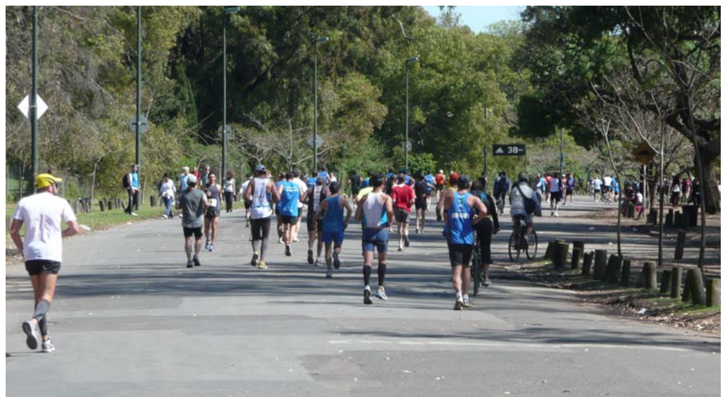
Nur noch knapp 4 km bis zum Ziel, dann ...

auf der wir morgens auch gestartet waren. Allerdings ging es nicht auf direktem Weg dorthin, sondern wir liefen noch eine große Schleife durch den Park mit einer Runde um den Lago de Palermo. Hier auf den Wegen am See waren inzwischen auch viele Spaziergänger unterwegs, die mit dem Marathon eigentlich nichts am Hut hatten, sondern vor dem Mittagessen nur eine kleine Runde im Park drehen wollten.