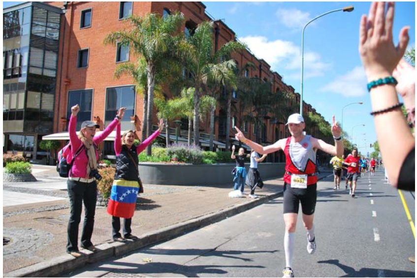
Eine unerwartete Anfeuerung auf der Avenida Alicia Murau de Justo