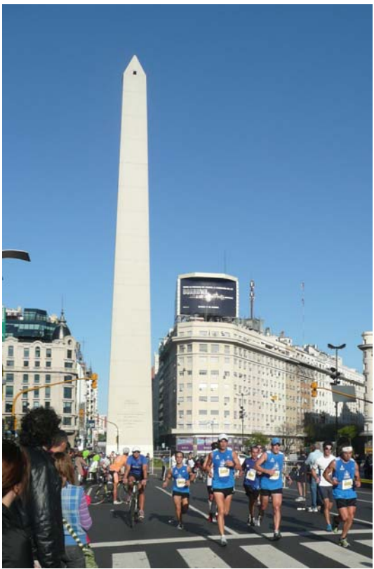
Blick zum großen Obelisken

Wir liefen am Zentralbahnhof vorbei, passierten die Plaza San Martin und bogen dann ab in die engeren Straßen des Microcentro, so dass der Charakter auch langsam etwas städtischer wurde. Nach knapp einer Stunde Laufzeit bogen wir auf die Nebenstraße der Avenue 9 de Julio ein und liefen auf den großen Obelisken zu, der zu den Wahrzeichen von Buenos Aires gehört.