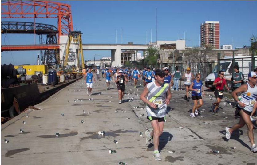
... zur Verpflegungsstation bei km 18 am Rio de la Plata und ...

So blieb es leider auch auf dem folgenden Streckenabschnitt, der uns auf der Avenida Don Pedro de Mendoza am Ufer des Rio de la Plata entlang durch den Hafen führte. Insgesamt war es hier nicht sehr schön zu laufen, denn linker Hand verlief eine Autobahn auf Stelzen und rechts dümpelten die Fischkutter an der Kaimauer. Naja, auch dieser wenig einladende Bereich der Strecke war geschafft, als wir auf die Halbinsel am alten Hafen Puerto Madero einbogen. Hier befand sich die Zeitnahme der ersten Streckenhälfte, für die ich 1:57:37 h gebraucht hatte.