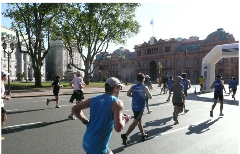
Vom Präsidentenpalast auf der Plaza de Mayo ...

Hier führte uns die Laufstrecke dann rechts an der Casa Rosada vorbei auf die Avenida Paseo Colon, weiter durch den Stadtteil San Telmo in Richtung La Boca. Dort passierten wir nach knapp 1:30 h Laufzeit bzw. 16 km das Stadion der Boca Juniors, die „Bonboniere“, und durchquerten anschließend auch das Künstlerviertel Camenito mit seinen bunten Häusern. Am Freitag, während der Radtour, herrschte hier noch ein munteres Treiben mit vielen Menschen in den winkeligen Straßen, aber am frühen Sonntagmorgen waren wir Läufer hier doch ziemlich allein unterwegs.