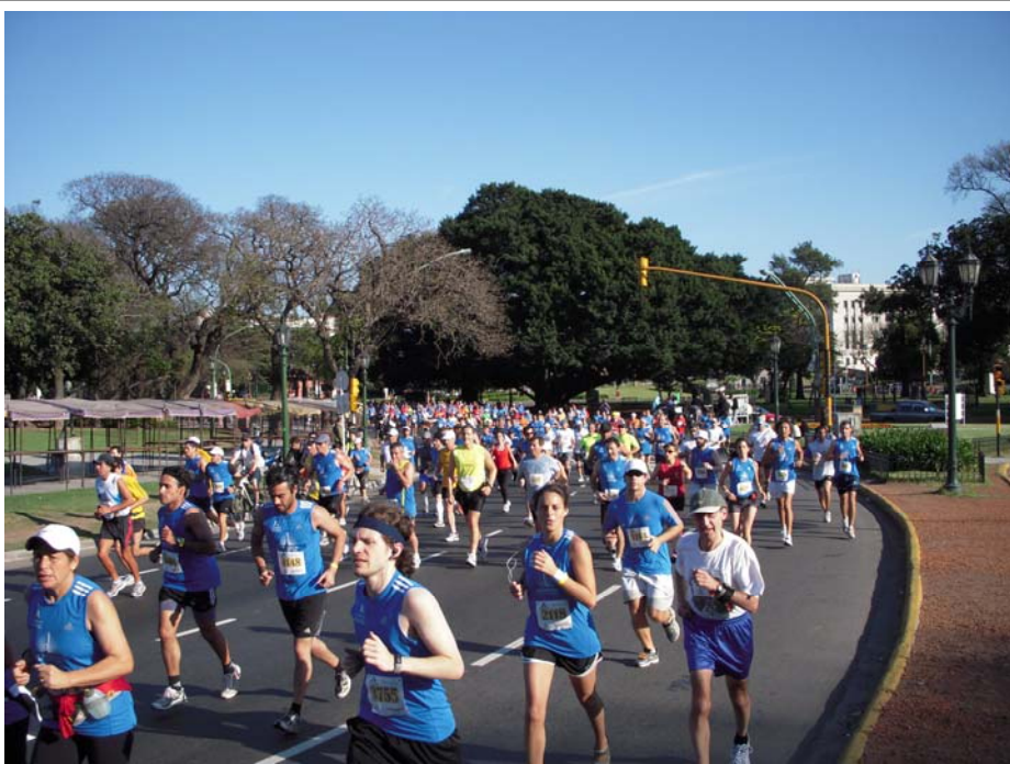
Endlich unterwegs auf den breiten Straßen im Stadtteil Palermo

Auf den breiten Straßen außerhalb der Absperung löste sich das Gedränge jedoch erfreulich schnell auf. Ich hielt mich am linken Streckenrand und fand erstaunlich schnell einen vernünftigen Laufrhythmus. Die Laufstrecke führte die ersten km auf einer breiten Allee mit weiten Parks rechts und links entlang durch den Stadtteil Palermo, bevor es dann auf der Avenida Libertadores in Richtung Innenstadt ging. Das Laufen bei sonnigem Frühlingswetter und Temperaturen um 15° C war sehr angenehm. So angenehm, dass ich