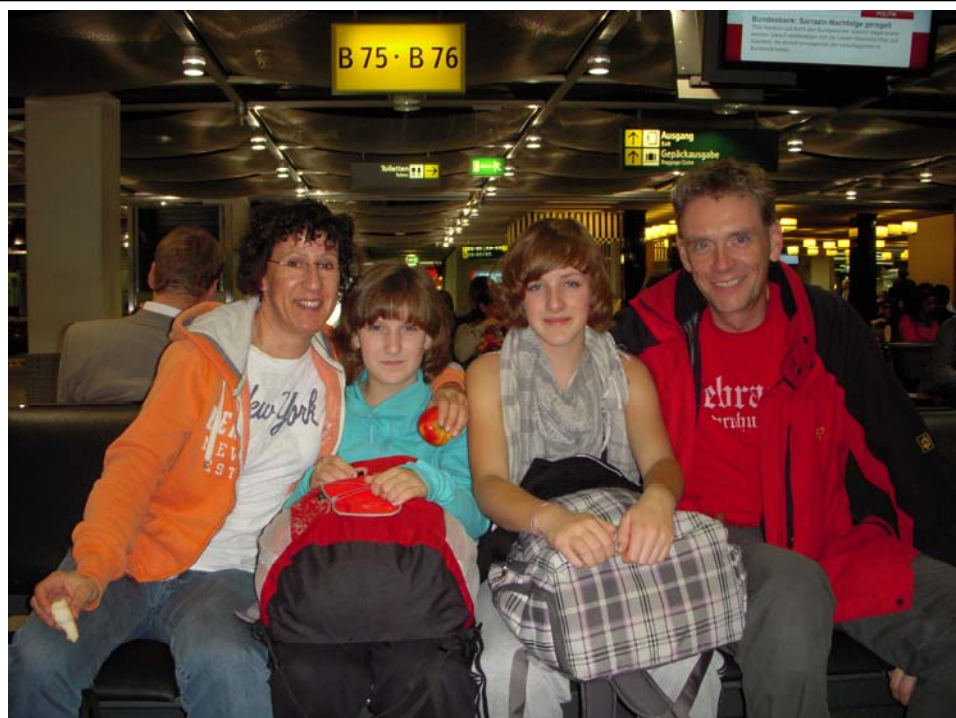
Gleich geht's mit dem Flieger ab nach Buenos Aires!

noch gegen Gelbfieber impfen lassen, 2 zusätzliche große Koffer kaufen, die notwendige Kleidung für Temperaturen zwischen 3 – 28°C auswählen und unsere Töchter davon überzeugen, dass man eine Trekking Tour in Feuerland nicht in Flip-Flops oder Chucks absolvieren kann. Auch die letzten Tage bei der Arbeit verliefen noch alles andere als ruhig, aber es hat schließlich noch alles geklappt, so dass wir am Donnerstagabend pünktlich in Düsseldorf in den Flieger steigen konnten, um via Paris nach Buenos Aires zu fliegen.