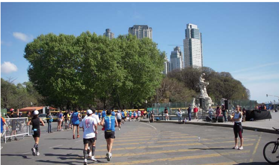
... dann bei km 22 am Fuentes las Nereidas vorbei, weiter auf der Avenida Espana.

Grün des rechter Hand liegenden ökologischen Schutzgebietes sowie der Gedanke, dass ich schon mehr als die Hälfte geschafft hatte, halfen mir über diesen kurzen Durchhänger hinweg. Im Abstand von 200 - 300 m standen hier Grillbuden, an denen man sich an diesem sonnigen Sonntagvormittag auf den erwarteten Ansturm der Gäste vorbereitete, ohne die vor-