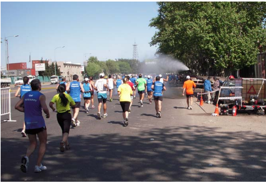
Eine Erfrischung auf der Avenida Comodoro Py, km 31 / 2:55 h Laufzeit

Die Laufstrecke führte dann auf der Avenida Antardis Argentina in Richtung Retiro. Zur Rechten ging es weiter an den Hafenbecken entlang und zur Linken standen hinter den vielen Rangiergleisen die in der Sonne glänzenden Hochhäuser mit den lokalen Verwaltungszentralen der internationalen Konzerne. An den Parks mit dem dahinter liegenden Zentralbahnhof bogen wir nach rechts ab auf die Avenida Comodoro Py, und es folgten knapp 3,5 km durch das Gewerbegebiet zwischen Zentralbahnhof und Containerhafen in Richtung Flughafen Jorge Newbery, so