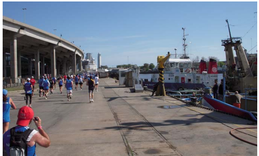
... durch den Hafen zwischen Autobahn und Fischkuttern ...

Ich war zufrieden, die Plantar-sehne hatte sich ruhig verhalten und ich fragte mich, ob ich auf der zweiten Streckenhälfte genauso gut zurecht kommen würde. Zu Beginn der 2. Halbzeit liefen wir noch durch ein Gewerbegebiet, bevor es dann auf der Avenida Espana wieder in einen offeneren Streckenabschnitt überging. Auf der folgenden ca. 3 km langen, schnurgeraden und etwas eintönigen Promenade musste ich mich erstmals richtig zusammenreißen, um nicht in einen schlurfenden Trott zu verfallen. Aber der Blick auf das satte