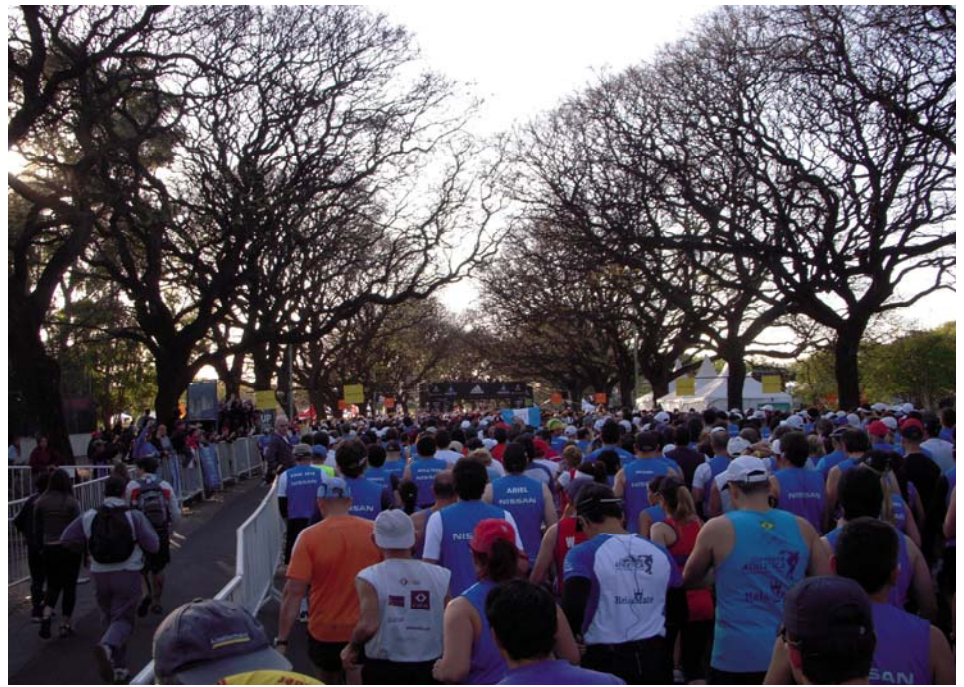
Das übliche Gedränge im Startblock gibt es auch in Buenos Aires

Zum pünktlichen Start um 07:30 h hatte ich meinen Startblock nicht mehr erreicht, sondern ich befand mich irgendwo im hinteren Drittel der Startaufstellung. Egal, ich hatte mir nach der bescheidenen Vorbereitung (s.o.) für diesen Frühjahrsmarathon im Oktober ohnehin keinen Angriff auf die PB vorgenommen, also würde ich damit schon zurechtkommen. Ich wartete noch kurz bis auch mein Garmin die südlichen Satelliten geortet hatte, und trabte dann mit dem Feld langsam über die Startlinie.